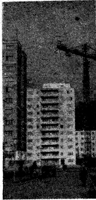
Verticale noi în cartierul Aeroport — Petroșani. În această zonă modernă a orașului, mii de oameni ai muncii care locuiesc în noile blocuri, beneficiază de confort și condiții civilizate de viață.

bolnăvirilor, ce trebuie să o desfășoare spitalul ca unitate sanitară complexă, o importanță deosebită și prevede expres în art. 30 că „stabilește măsurile necesare pentru prevenirea și combaterea bolilor cu pondere importantă și a celor transmisibile”; „asigură controlul stării de sănătate a unor grupe de populație supuse unui risc crescut de îmbolnăvire”; „efectuează examene de specialitate pentru controlul aplicării normelor de igienă”; „organizează acțiuni de educație sanitară”. În ceea ce privește asistența medicală, același articol obligă spitalul să acorde asistența medicală de urgență, generală și de specialitate bolnavilor ambulatori și spitalizați, să stabilească capacitatea temporară de