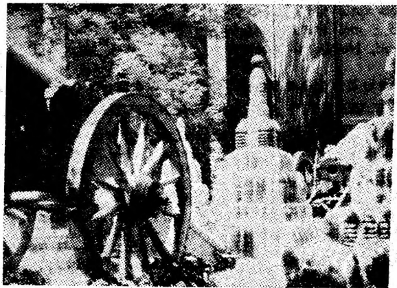
Grivița, Plevna, Smîrdan - locuri istorice cu profundă rezonanță, adînc întipărite în conștiința neamului. În clișeu: Plevna - unul din monumentele dedicate războiului împotriva turcilor din 1877.