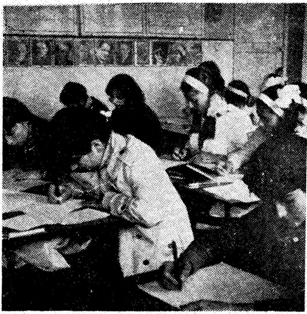
Instantaneu din concurs.

Metodă de stimulare a pregătirii elevilor, potrivit cu aptitudinile manifestate spre diferite obiecte de învățămînt, concursurile elevilor au și pronunțate elemente de educare și stimulare. Duminică, la Școala generală nr. 1 din Petroșani s-a desfășurat faza județeană a concursului pe obiecte al elevilor din învățămîntul gimnazial al Văii Jiului. Zeci de elevi au participat la următoarele discipline de studiu: limba română, limba maternă, limbi moderne (engleză, franceză, germană), istorie, matematică, fizică. Aceste forme de verificare competitivă a celor mai buni elevi, reprezintă, totodată, și o stimulare a activității cadrelor didactice.