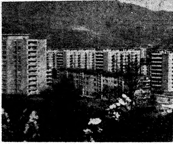
Cadru din cartierul Coroești - Vulcan.