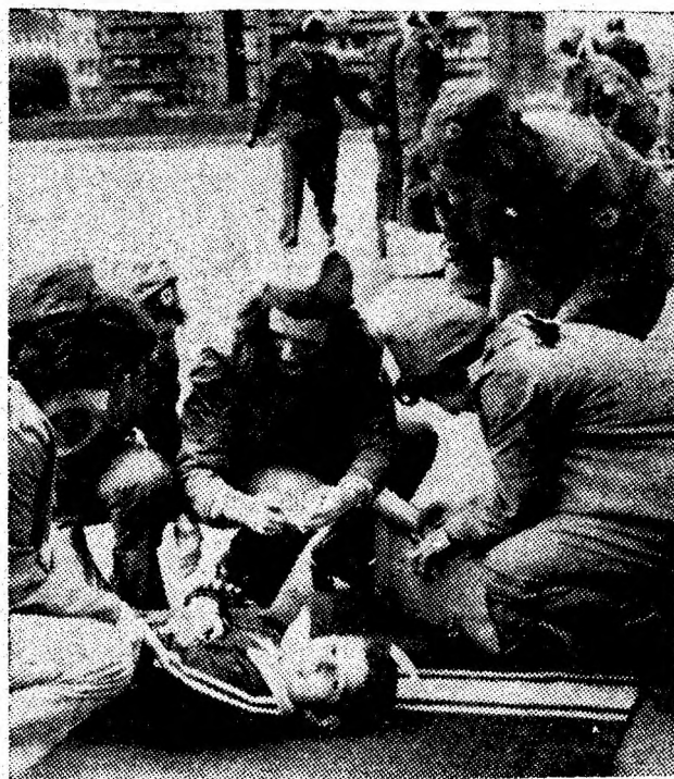
Instantaneu din timpul probei practice susținute de formația sanitară de Cruce Roșie de la I.U.M. Petroșani.

Moment important în activitatea formațiilor sanitare de Cruce Roșie din Valea Jiului, faza municipală a concursului acestora s-a desfășurat duminică la Petroșani în incinta Școlii generale nr. 1. Au luat parte formațiile sanitare de Cruce Roșie fruntașe, cîștigătoare ale confruntărilor din etapa de masă a concursului. Localitățile Petroșani, Lupeni, Vulcan și Aninoasa, spre exemplu, au fost reprezentate, în ordine de formațiile sanitare de Cruce Roșie de la I.U.M.P., I.F.A. „Viscoza” și I.M. Paroșeni, respectiv, cartier Aninoasa. Susținerea celor trei probe de concurs — activitatea la locul de muncă, teoretică și practică — și notele obținute, a dat cîștig de cauză formației sanitare de Cruce Roșie de la I.U.M. Petroșani, cîștigătoare a locului I și a dreptului de a reprezenta Valea Jiului la faza județeană a concursului. Locurile II și III au revenit formațiilor de la Aninoasa și Lupeni, iar pe locul IV s-a situat formația de la I.M. Paroșeni. (T.T.)