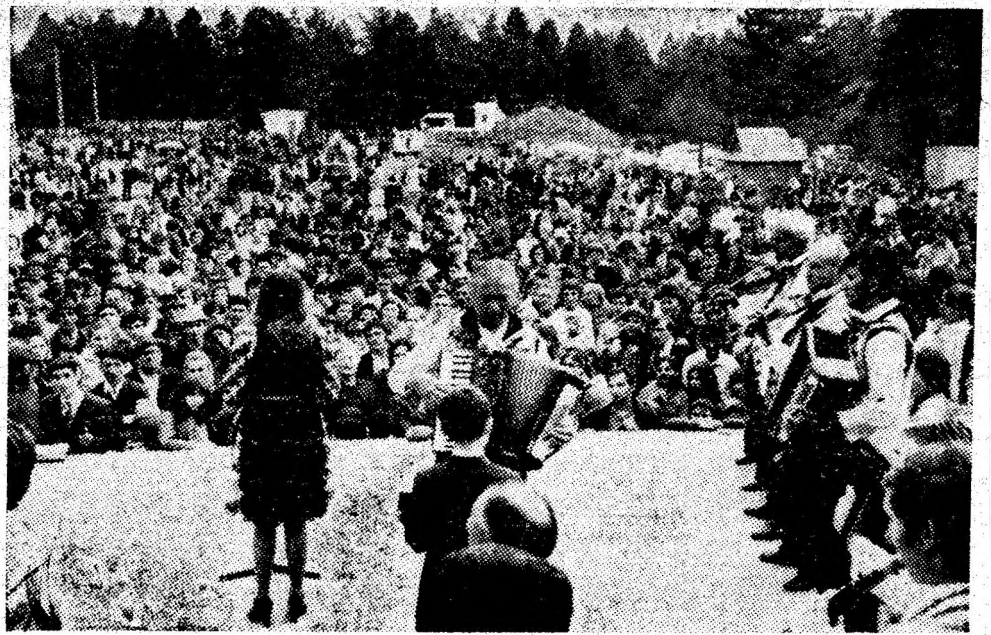
Locul de agrement Brazi din Vulcan. Imaginea este concludentă pentru marea serbare cîmpenească ce a avut loc duminică în acest cadru natural pitoresc.