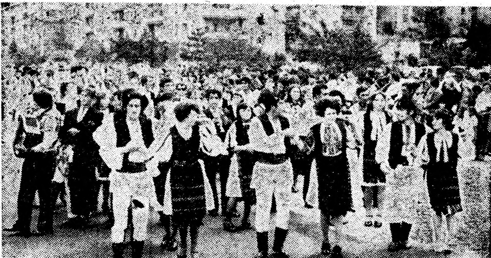
Parada portului, cîntecului și jocului popular pe străzile Vulcanului.