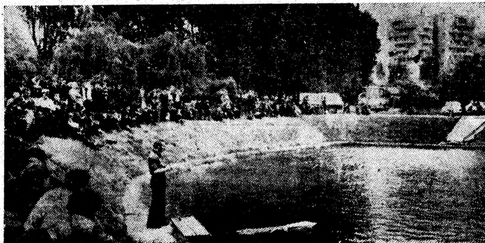
Evaluează în concurs multiplul campion național Leontin Ciortan.