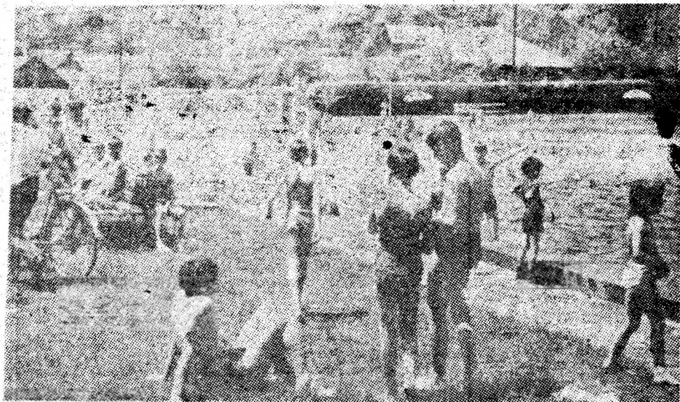
Zilele însorite fac ca ștrandul din Lupeni să exercite o atracție deosebită pentru iubitorii înotului.