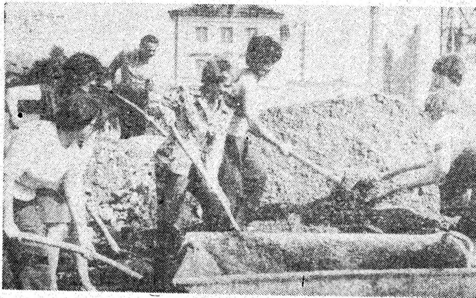
Tinere de la Spitalul municipal Petroșani lucrează pe șantierul blocului 69 din oraș.

Convorbire consemnată de Gheorghe OLTEANU