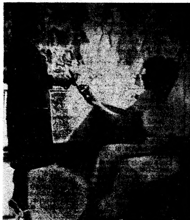
În zilele călduroase încălțămîntea ușoară și comodă este mult căutată. Magazinul de încălțămîntă din complexul „Hermes” Petroșani oferă cumpărătorilor o largă gamă de asemenea încălțămîntă pentru femei și bărbați.

le și televizoarele portative, de cele mai noi tipuri, robotul de bucătărie și alte articole de uz casnic prin care se ușurează efortul gospodinelor, diferite articole de sezon pentru sport și turism, etc. V. S.