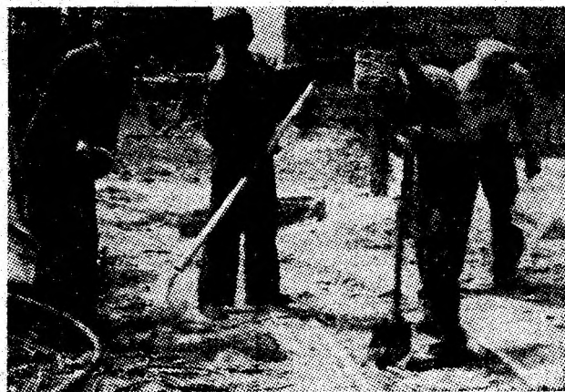
Din inițiativa organizației U.T.C. tinerii de la I.M. Aninoasa participă la acțiunile de colectare a fierului vechi din incinta întreprinderii.

nu este vorba, în acest caz, de nepăsare, cu atît mai mult cu cît directorul întreprinderii amintite, căruia i-am făcut cunoscut acest fapt, ne-a asigurat că este vorba de un robinet, pe care, muncitorii, atunci cînd participă la intervenții, îl lasă deschis cu scopul de a-și desfășura nestingheriți lucrările. Dar au trecut luni de cînd am așteptat, în zadar, ca cel puțin noaptea sau în zilele de sîmbătoare această pierdere de apă să dispară. Lucrurile nu s-au petrecut însă așa. Ba mai mult, „vina” de apă care se scurge neînterupt pe... apa sîmbetei s-a îngroșat. Ca oameni de bună credință am crezut la început în obiectivitatea motivului invocat. Faptul că nu se schimbă însă nimic ne obligă să ne îndoim că justificarea dată și-ar fi avut temei. Ne adresăm deci, din nou, celor în drept: de ce, totuși la Livezeni, apa este lăsată să curgă fără rost? (A.H.).