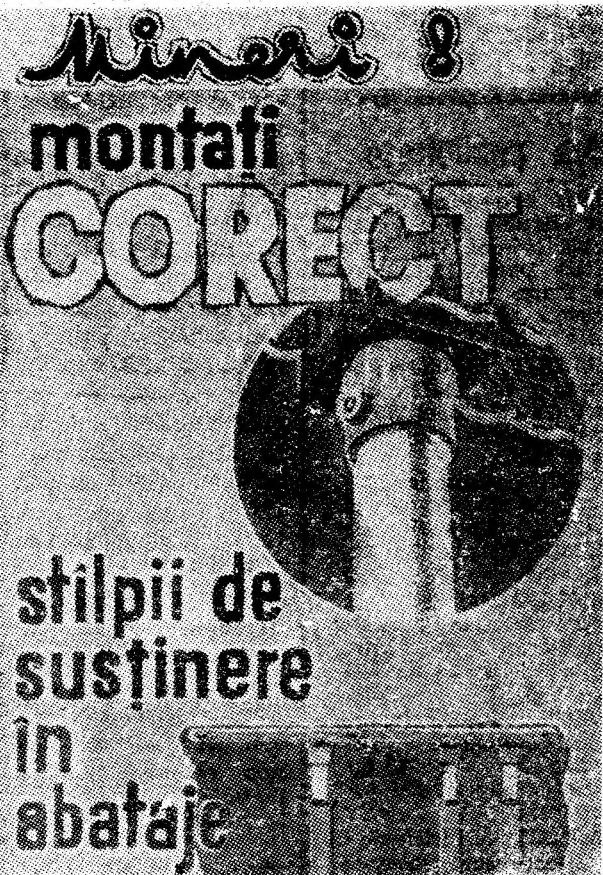
Pagină realizată la cererea Combinatului minier Valea Jiului.

● Măsuri hotărîte se impun pentru îmbunătățirea de ansamblu a propagandei de protecție a muncii. În acest context, se vor intensifica acțiunile cu filmul documentar, cinematografele din centrele miniere avînd sarcina ca, înainte de începerea filmelor artistice, să organizeze proiecții de pelicule de protecție a muncii cu aspecte specifice mineritului.