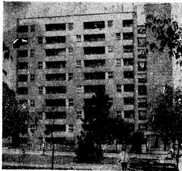
Prin orașul de azi al minerilor — Uricani.