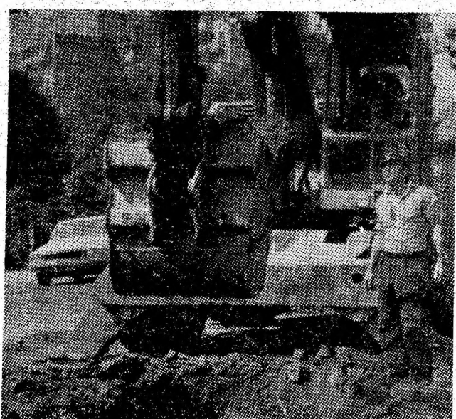
Se lucrează intens la noua canalizare a uneia din arterele principale ale Petroșaniului.