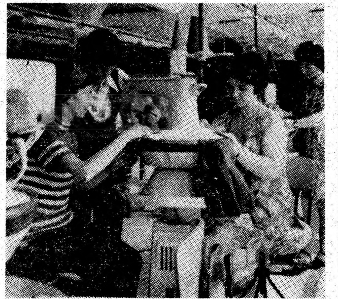
La noile utilaje cu care a fost dotată fabrica de tricotate din Petroșani, viitoarele confecționere din secția confecții își însușesc tehnica de lucru.

În problemele analizate, plenara a adoptat măsuri corespunzătoare.