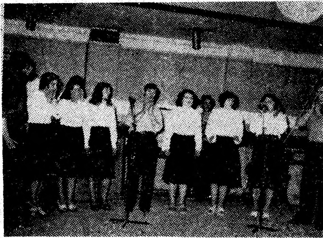
Brigada artistică a I.U.M. Petroșani într-unul din spectacolele prezentate în fața muncitorilor din întreprindere.

● Bienala „Lupeni '78“. În cadrul Festivalului național „Cîntarea României“, fotoclubul „Cristal“ din Lupeni organizează în luna octombrie — sub egida Comitetului de cultură și educație socialistă al județului Hunedoara, Consiliului județean al sindicatelor, Comitetului sindical al întreprinderii miniere Lupeni și Asociației Artiștilor Fotografi din țara noastră — prima ediție a unei expoziții bienale de artă fotografică interjudețeană cu tema „Omul“. Sintem informați că au început deja să sosească lucrări (ultimul termen de predare — 1 septembrie): 36 de autori din Cluj-Napoca și Oradea au trimis 56 de fotografii.