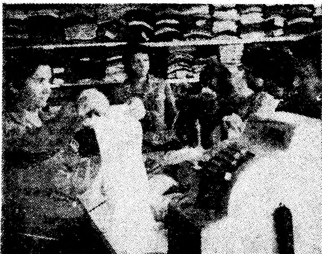
Instantaneu de la unitatea nr. 15 din cadrul noului complex comercial din Petrila.