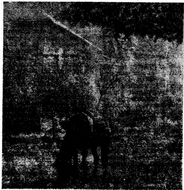
Imagine pastorală? Aș! Cadru cotidian pe artera principală a Petroșaniului în primele ore ale dimineții.