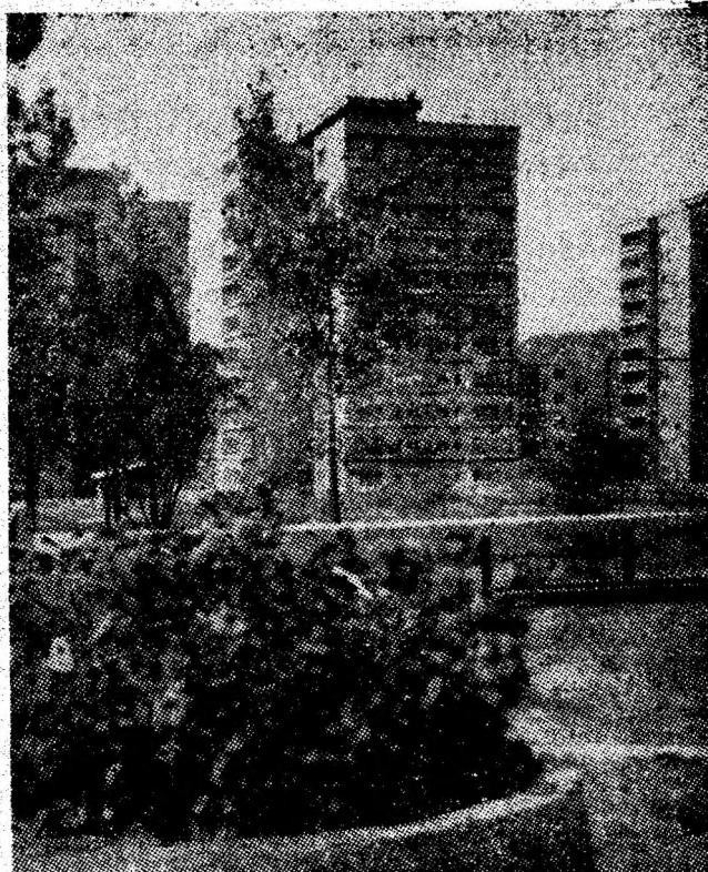
Armonie și flori, caracteristicile noului centru civic al Petrosaniului.

Șirul succeselor continuă. În luna august, toate cele cinci brigăzi și-au depășit sarcinile de plan.