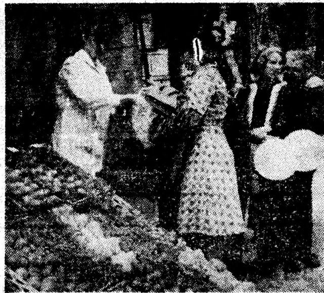
În zilele de repaus, lucrătorii C.L.F.-ului din Petroșani sînt prezenți la locul de agrement „Brădet”.