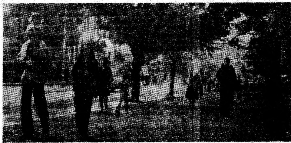
Imagine matinală într-un început de toamnă însoțită

Și, de fapt, trăim azi cu toții anotimpul muncii libere, al bucuriei și demnității.