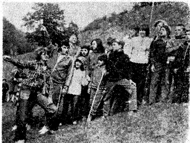
Elevii veniți în tabără fac cunoștință cu frumoșele Văii Jiului.