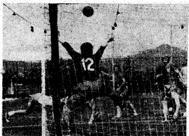
Clipe spectaculoase la poarta echipei Metalul Hunedoara (handbal).