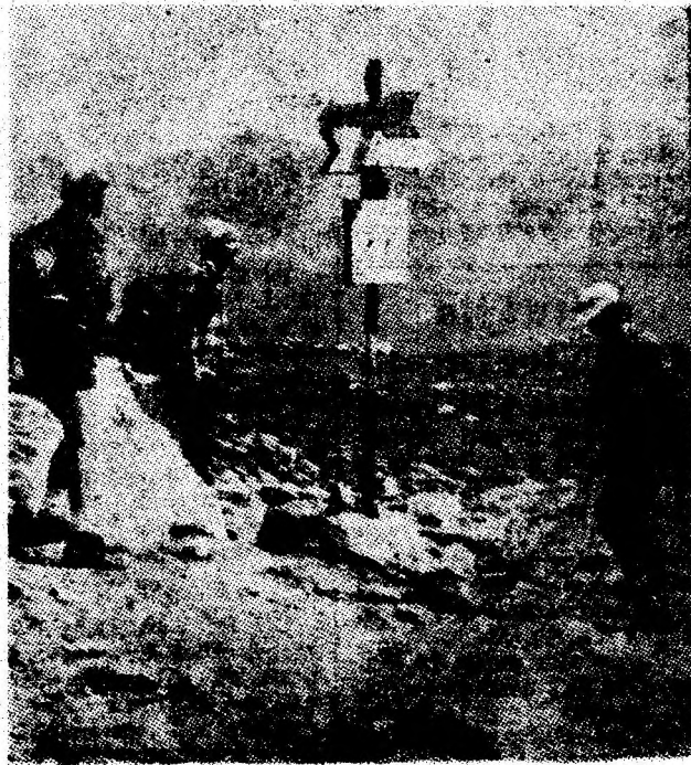
La punct de răscruce. Încotro o luăm? — pare să spună grupul de turiști ce fac un scurt popas la întretăierea potecilor alpine. De, drumeția își are farmecul ei în orice anotimp.