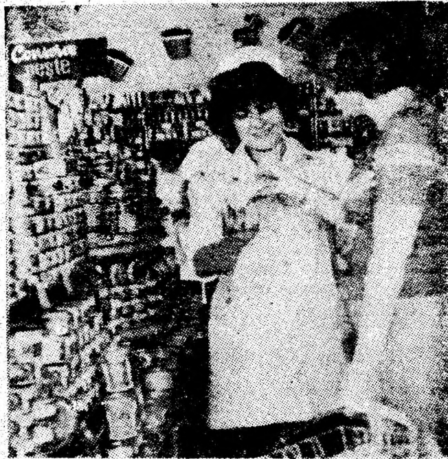
Bine aprovizionat, magazinul cu autoservire nr. 12 din cartierul Aeroport — Petroșani răspunde permanent cerințelor cumpărătorilor.

Ideea neatârării țării își face drum cu tot mai multă vigoare în Moldova și Țara Românească, declanșându-se o acțiune politică sistematică în vederea cucerii independenței. Datorită fondului etnic comun și conștiinței naționale, tot mai activă de la epocă la epocă, veacul al XIX-lea este perioada istorică în care se împlinesc o parte din aspirațiile seculare ale poporului pentru unitate și independență. Acțiunile revoluționare din 1821 și 1848, deși înăbușite, au accentuat lupta pentru înlăturarea proiectelor și idealurilor prezente în programul pașoptiștilor — libertate și unitate. Procesul de formare a statului național unitar intra într-o etapă nouă după 1859, stimulând acțiunea maselor populare timp de aproape 60 de ani. Până la 1 decembrie 1918, moment istoric strălucitor pentru care au luptat, generații după generații, cele mai înaintate forțe social-politice, întreg poporul.