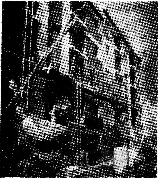
Una din scările blocului 50 A este deja finisată. Alte două scări vor fi terminate în următoarele zile.