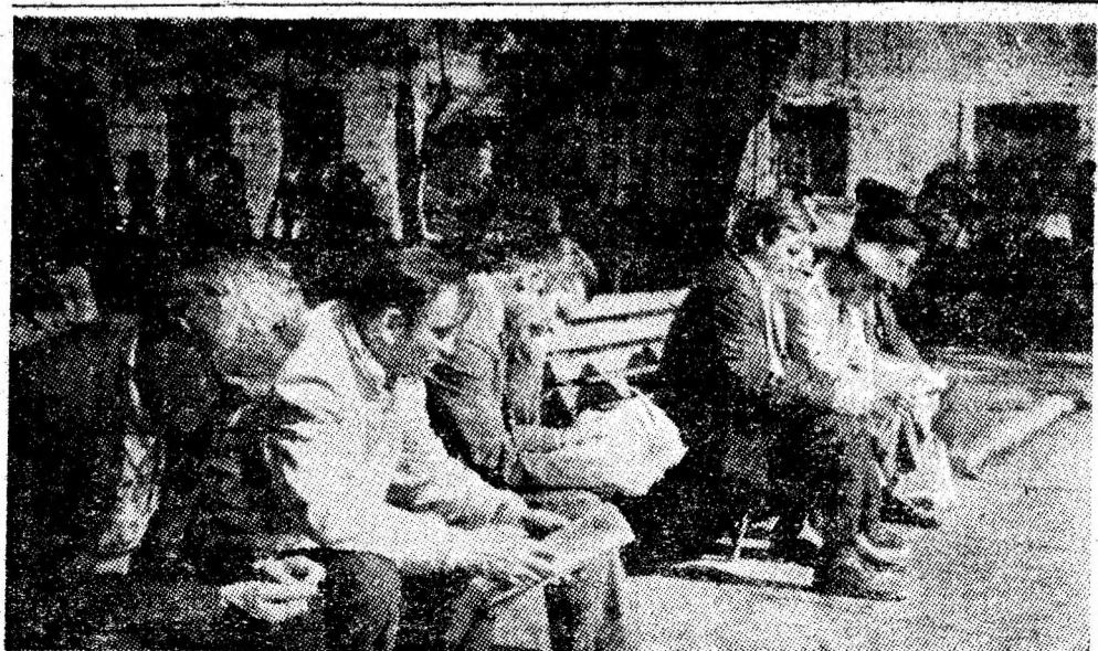
Profînd de zilele însoțite de toamnă.