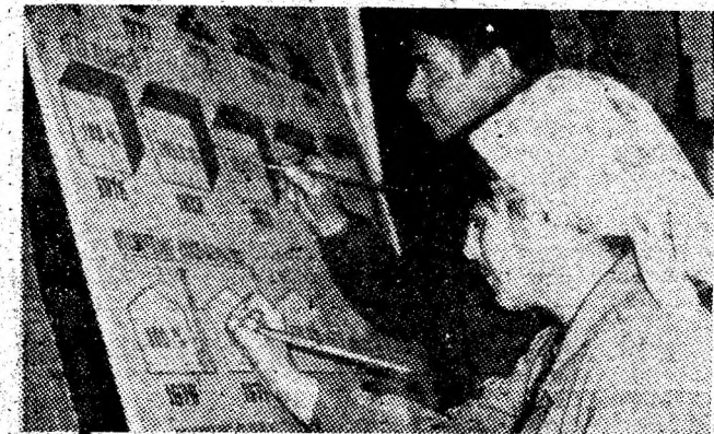
În atelierul de vopsitorie al Preparației Coroșej se execută un panou reprezentînd realizările în extracția de cărbune special destinată centrelor siderurgice.