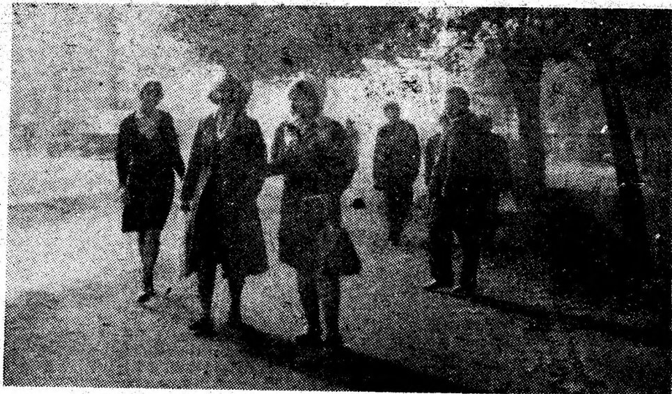
Dumneștile noastre... londoneze.