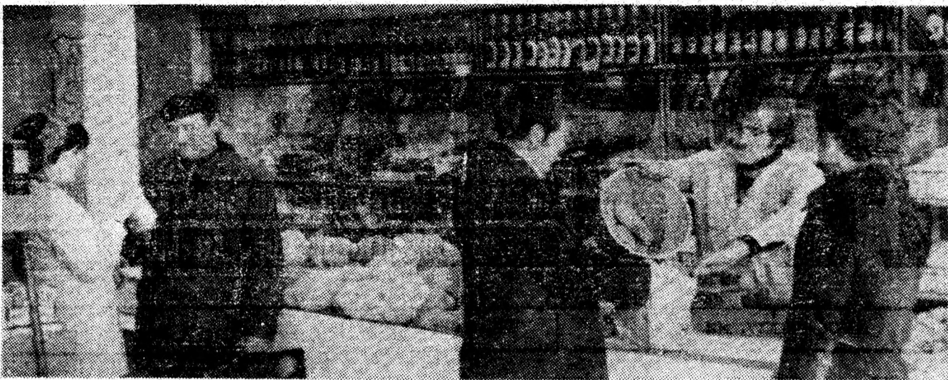
Unitatea C.L.F. nr. 3 din cartierul Aeroport—Petroșani, o unitate cu autoservire modernă în ordine și bună servire.