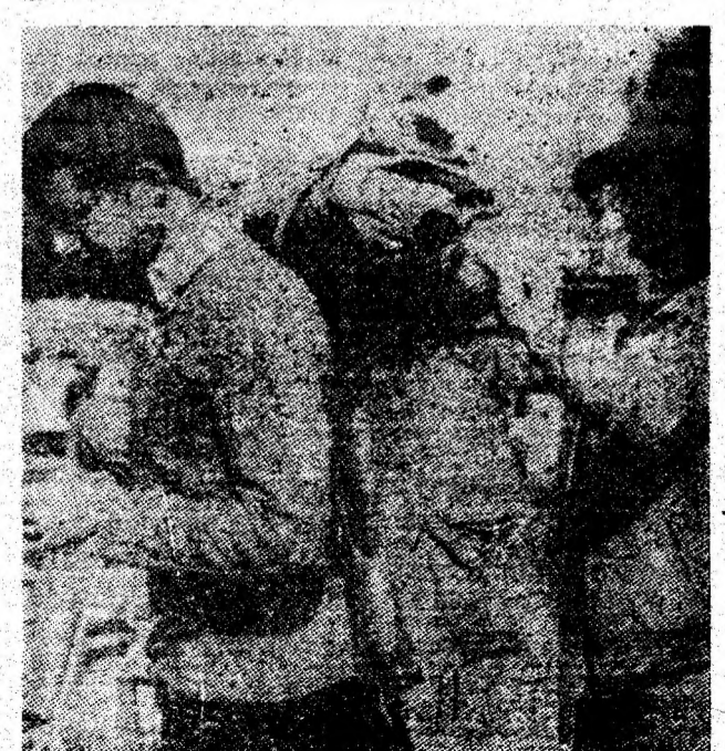
Ultimele verificări înaintea startului spre munte.

Cînd am plecat din incinta minei Dilja apăruse, deja, în sala de apel un panou cu numele și realizările schimbului III de transport. Munca le era răsplătită material și moral, și fiecare din cei premiați purta în suflet mîndria de a-și fi făcut datoria cu prisosință.