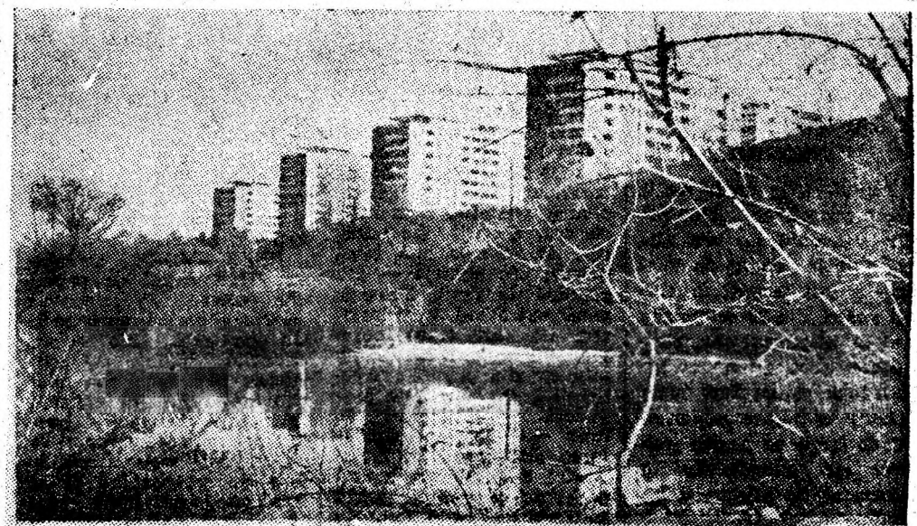
Vulcan — acuarelă de toamnă.