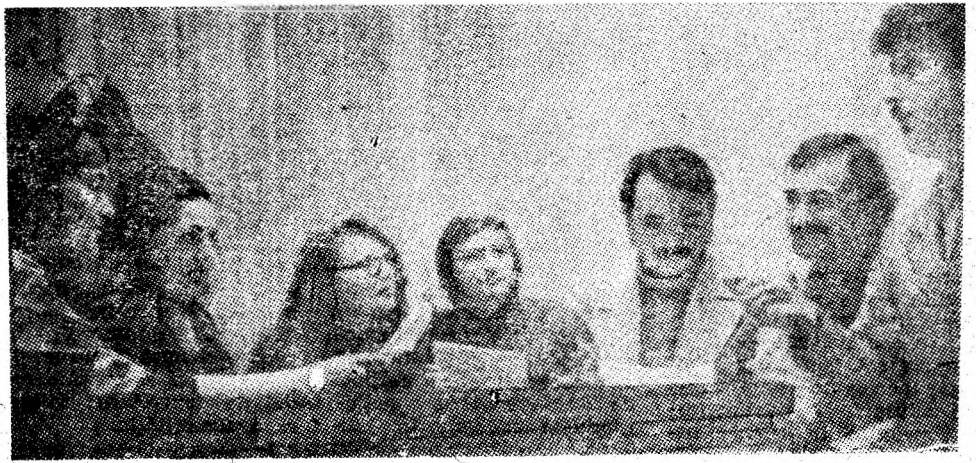
Se pregătește, la masă deocamdată, o nouă piesă de teatru cu care în curînd formația artistică a Casei de cultură Petroșani se va prezenta la faza orașenească a celei de a doua ediții a Festivalului național „Cîntarea României”.

valului național „Cîntarea României”, ediția a doua.