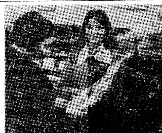
Magazinele de specialitate din municipiul nostru oferă o gamă largă de articole de îmbrăcăminte pentru sezonul rece. În foto: instantaneu din magazinul de tricotate nr. 330 din Lupeni.