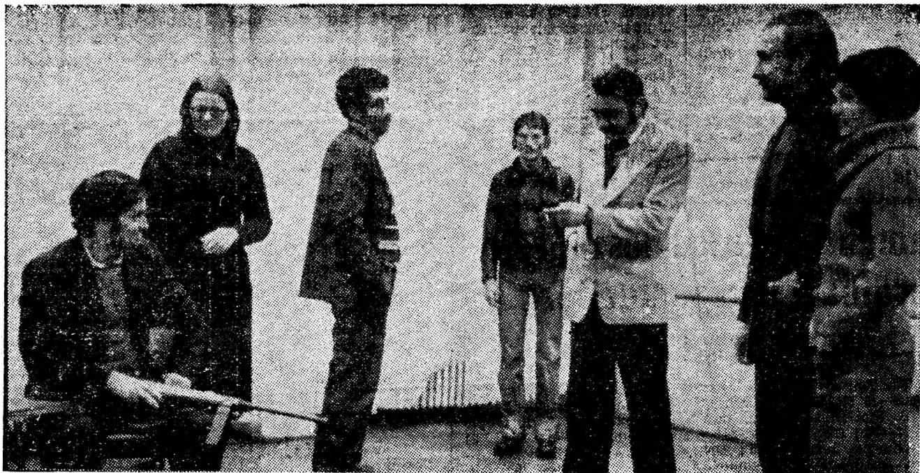
O ultimă repetiție a formației de teatru a Casei de cultură din Petroșani la piesa „Zorile la 4,54” de Ionel Hristea, în regia lui George Negraru — piesă cu care mîine formația se prezintă la concursul Festivalului național „Cîntarea României”, ediția a II-a care se va ține la Hunedoara.

● Brigada artistică a Întreprinderii miniere din Petrila va susține, astăzi (la ora 16,30) un spectacol în sala de apel.