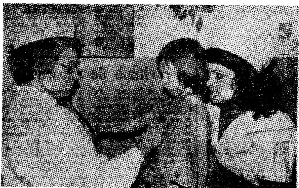
Consultație în cabinetul de pediatrie de la spitalul din Vulcan.