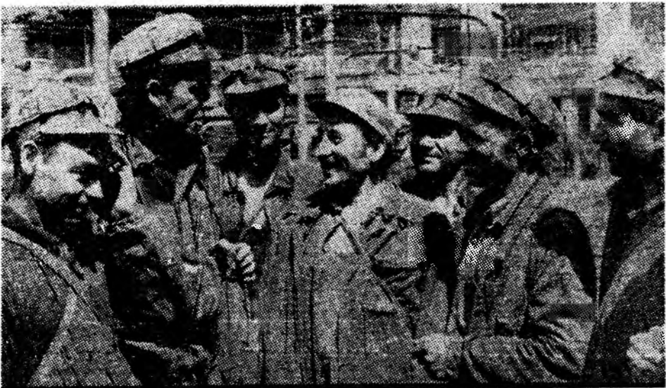
Minerii ai sectorului IV Lupeni.