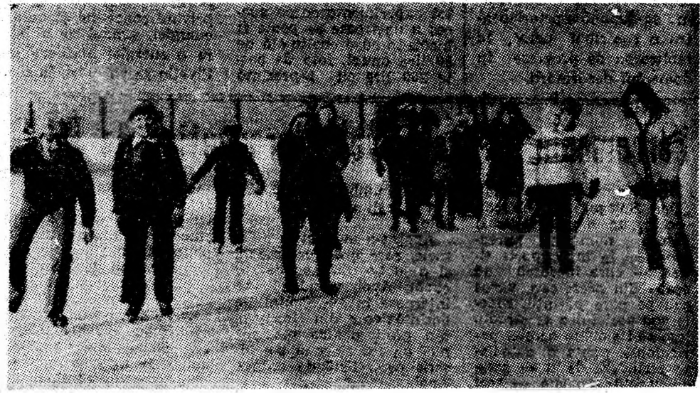
O veste bună pentru iubitorii patinajului din Lupeni. În cartierul Braia din Lupeni a fost amenajat, de către Asociația sportivă Preparatorul un nou patinoar.

se patinează cu multă plăcere. Patinoar a fost amenajat și la stadionul Jiul din Petroșani. A fost însă suficientă un pic de ninsoare ca patinoarul să fie acoperit zile în șir de un covor de zăpadă sub care hibernează... gheața și nepăsarea celor ce l-au amenajat dar nu-l mai întrețin. Cit despre patinoarele din Uricani, Vulcan, Petrița și Aninoasa sînt „sublime” dar lipsesc cu desăvîrșire. Se pune din nou, legitima întrebare: oare numai la Lupeni a venit iarna? (D.C.)