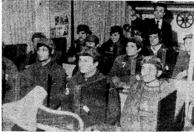
Cabinetul de protecție a muncii de la I. M. Paroșeni, în plină activitate.

Pagina de față, destinată problemelor de protecție a muncii, își propune să reflecte experiența unor colective de muncă, precum și unele neajunsuri, comandamente în acest domeniu.