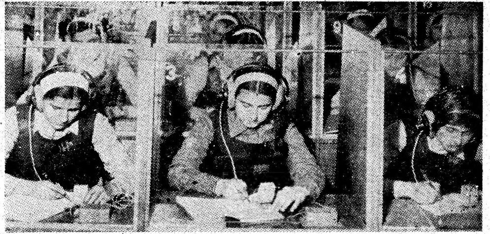
Oră de limba franceză în modernul cabinet de lingvistică al Liceului economic și de contabilitate din Petroșani.

N-a împlinit încă 26 de ani, dar dacă n-ar fi beneficiat de clemența legii, mai bine de șase i-ar fi petrecut în detenție. Pentru furturi în dauna avutului ob-