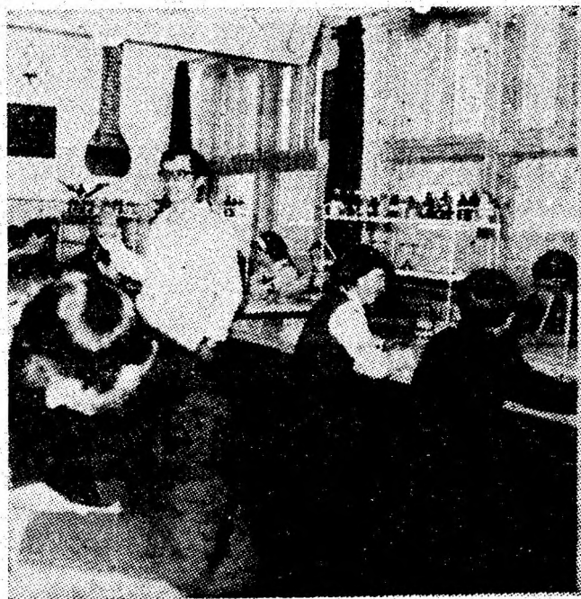
Oră de chimie în laboratorul Școlii generale din Uricani.

„Vă vom informa operativ, stimați cititori, cu constatările noastre sau ale specialiștilor amintiți ca și cu măsurile întreprinse prin materialele publicate sub genericul „comandamentele mecanizării”.