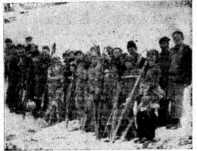
Imaginea vă prezintă cîțiva dintre participanții la etapa județeană de schi fond, categoria 14—19 ani, din licee și școli profesionale ale județului Hunedoara.