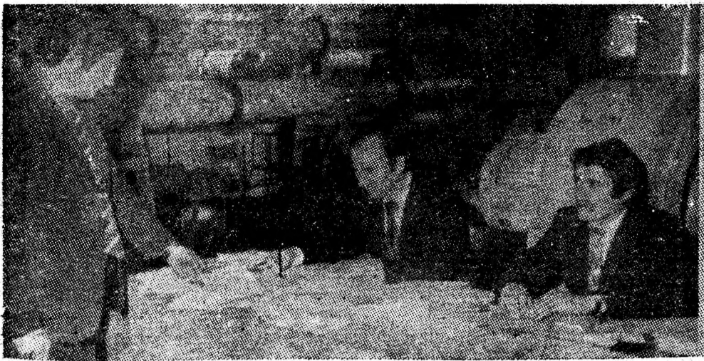
Examen la „Mecanisme și organe de mașini”, la I.M.P.