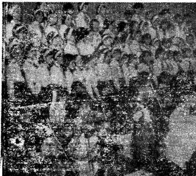
Un „mărtisor” melodic pentru mame oferit de elevii Școlii de muzică și arte plastice Petroșani, la Casa de cultură din Petroșani.