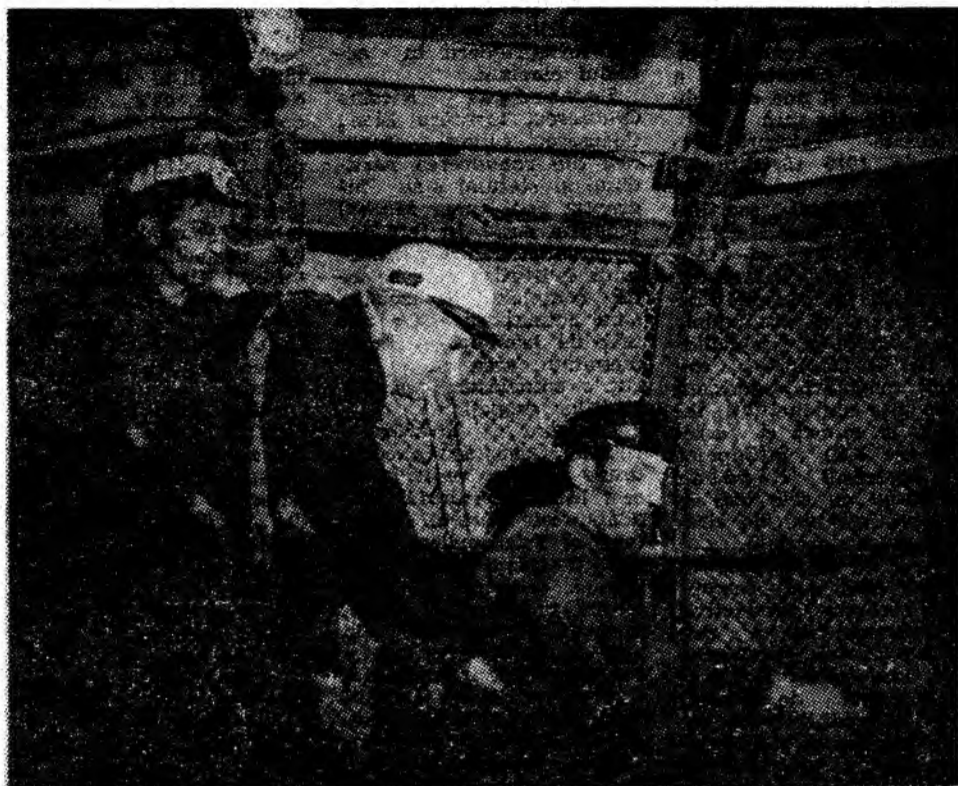
Din filmoteca redacției, reluăm o imagine grăitoare care ilustrează interesul deosebit al tovarășului Nicolae Ceaușescu față de viața și munca minerilor: aspect din timpul vizitei de lucru la mina Vulcan, 9 noiembrie 1977.

În viața municipiului nostru, vizitele de lucru ale tovarășului Nicolae Ceaușescu se înscriu ca momente deosebit de im-