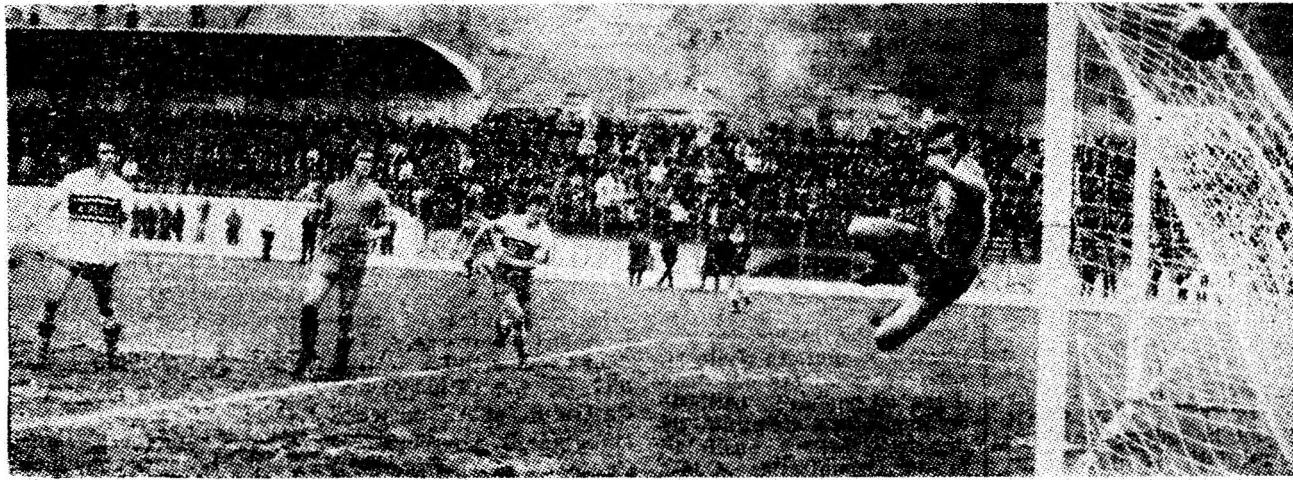
Nu, nu a fost gol. A fost o surpriză rezervată de... aparatul fotografic. Secvență din meciul Minerul Lupeni — Dierna Orșova.