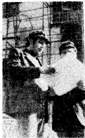
Pe șantierul fabricii de confecții din Vulcan.

Ne-am întrebât de ce oare vecinii lor din blocul nr. 42 (și multe altele din cartierul Aeroport — Petroșani) stau pasivi, nu au întreprins încă nimic pentru amenajarea zonelor verzi din preajma blocurilor în care locuiesc? Sperăm că nu se vor lăsa prea mult invitați, pentru că timpul este înaintat. Se impune, de asemenea, ca organele și organizațiile de partid din întreprinderi, instituții și cartiere, precum și deputații să intensifice mobilizarea forțelor pentru ca în cel mai scurt timp întregul oraș să devină o adevărată grădină.