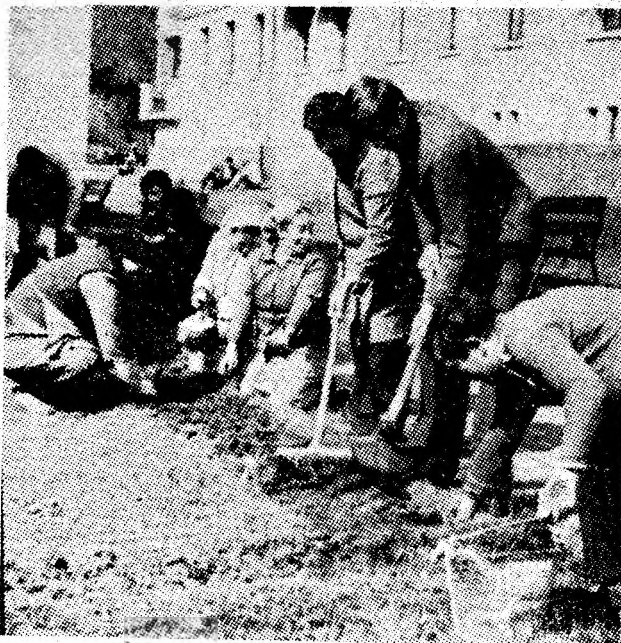
Activitate gospodărească în fața blocului E din Uricani.

Numeroase grupuri de tineri muncitori și elevi, de cetățeni ai Văii Jiului au folosit timpul prielnic al zilelor de simbătă și duminică, pentru continuarea acțiunilor de înfrumusețare.