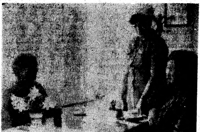
Ambianță plăcută la cofetăria din orașul Uricani

În sala de comandă și uzinei este liniște și cald. Se aude numai ritmul sacadat al aparatelor de măsură destușit printre vorbele oamenilor. Cei care mi-au relatat întâmplarea, par și acum emoționați. Lupta lor cu greul în lichidarea avariei a fost grea, acerbă, dar încununată de succes. Ei privesc, sînt oameni căliți la acest „foc continuu”, despre care am îndrăznit azi o metaforă, numindu-i „făuritori de lumină”.