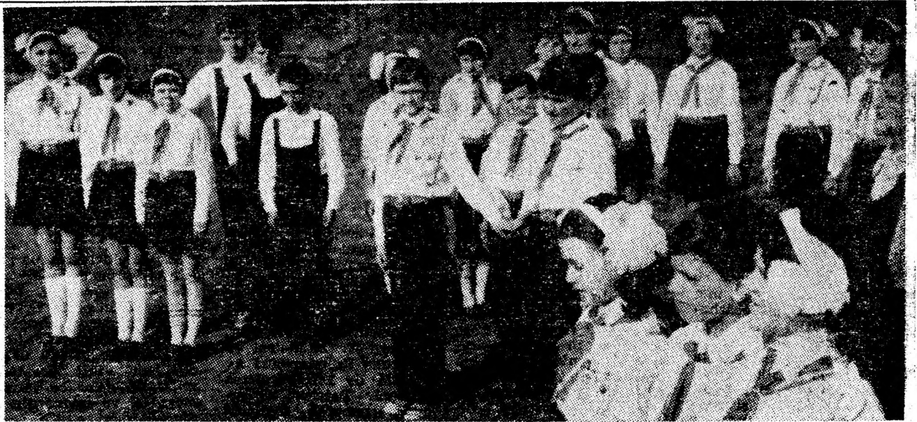
Formația pionierilor din Aninoasa, cîștigătoare a medaliei de aur la ediția a II-a a Festivalului național „Cîntarea României” a cărei fază finală a avut loc recent la Piatra Neamț.

ilor, care trăiesc și învață printre mineri. Cu adevărat remarcabilă este valoarea muncii, a repetițiilor îndelungate care ne permite acum să vedem un spectacol deschis și sponian al unor pionieri surizători. Opțiunea pentru această formație presupune o cunoaștere a disponibilităților artistice ale pionierilor și, de ce nu, reale calități de îndrumare, indispensabile instructorilor. Acest proces de cunoaștere și educație este evident la Școala generală din Aninoasa, unde s-au aplicat inițiative pionierești de autentică valoare morală. Succesul artistic înregistrat se alătură celorlalte acțiuni și activități pionierești și prefigurează o activitate fertilă în formarea tineretului școlar.