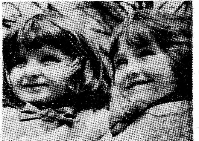
Un zîmbet în soare.

În salba sărbătorilor muncitorești, 1 Mai a fost și rămîne o zi a unității, forței și nobleței oamenilor muncii de pretutindeni.