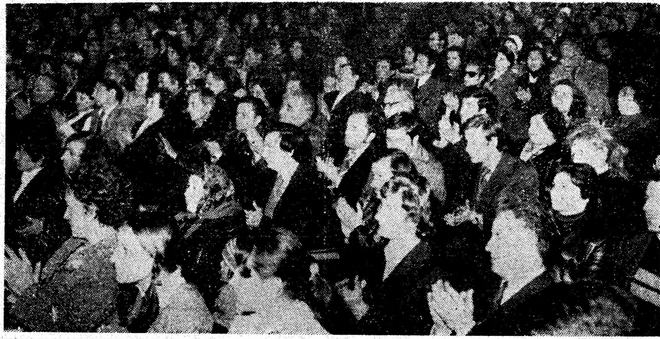
Aspect din timpul desfășurării adunării festive din Petroșani.