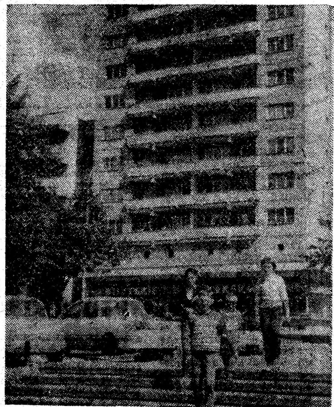
Crimpei din noua geometrie arhitectonică a centrului Petroșaniului.