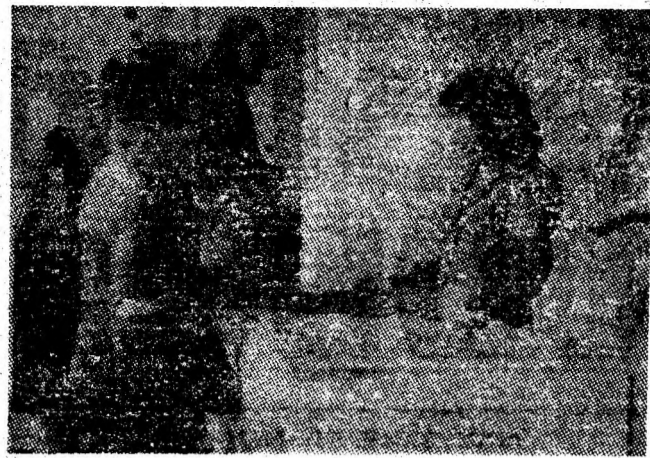
Modernul magazin nr. 102 cu articole pentru copii deschis recent în Vulcan.

În vederea îmbunătățirii sistemului informațional și de luare a unor decizii operative de către conducere, pentru soluționarea în timp optim a defecțiunilor tehnice și tehnologice, la mina Paroșeni a fost realizat un sistem automat de urmărire directă a procesului de producție din subteran și de la su-