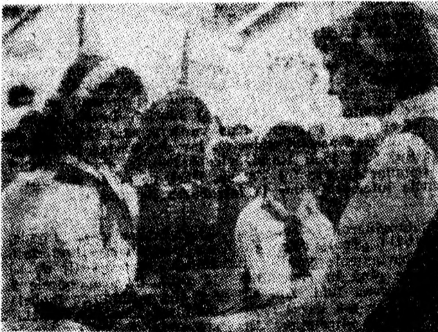
Clipe de emoții la Școala generală din Aninoasa. Absolvenții claselor a VIII-a predau cheia succesului elevilor dintr-a VII-a.

Din ancheta întreprinsă pe șantierul din Vulcan reiese clar că cele 64 apartamente vor fi predate conform planificării. De asemenea, aceasta demonstrează o dată în plus — dacă mai era nevoie — că atunci cînd se organizează mai bine activitatea în șantier, avîndu-se în vedere evitarea dispersării forțelor pe mai multe puncte de lucru, rezultatele sînt cele scontate — înscrierea în graficele de execuție și predarea în termen a tuturor obiectivelor construite.