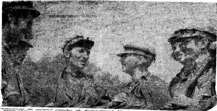
Colectivul de mineri...