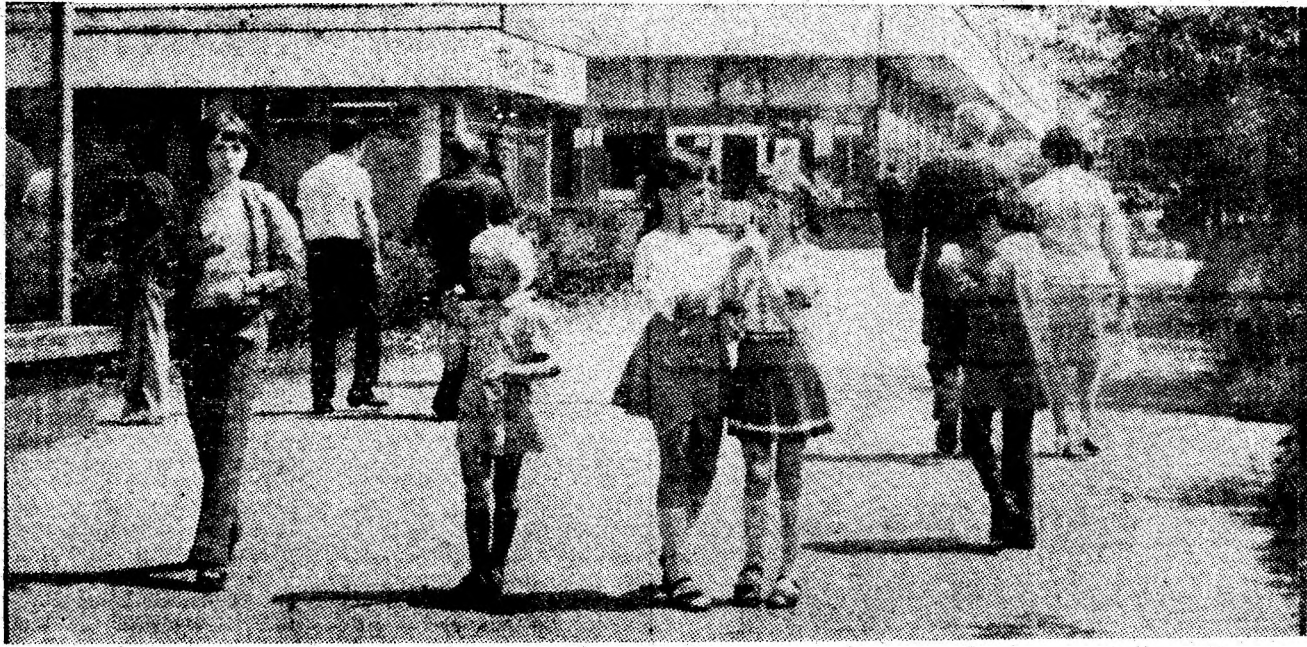
Copilărie senină în noile cartiere ale Petrilei.

Un gest de profund umanism ce exprimă solidaritatea muncitorească a colectivului. Vasile HOINOIU, corespondent