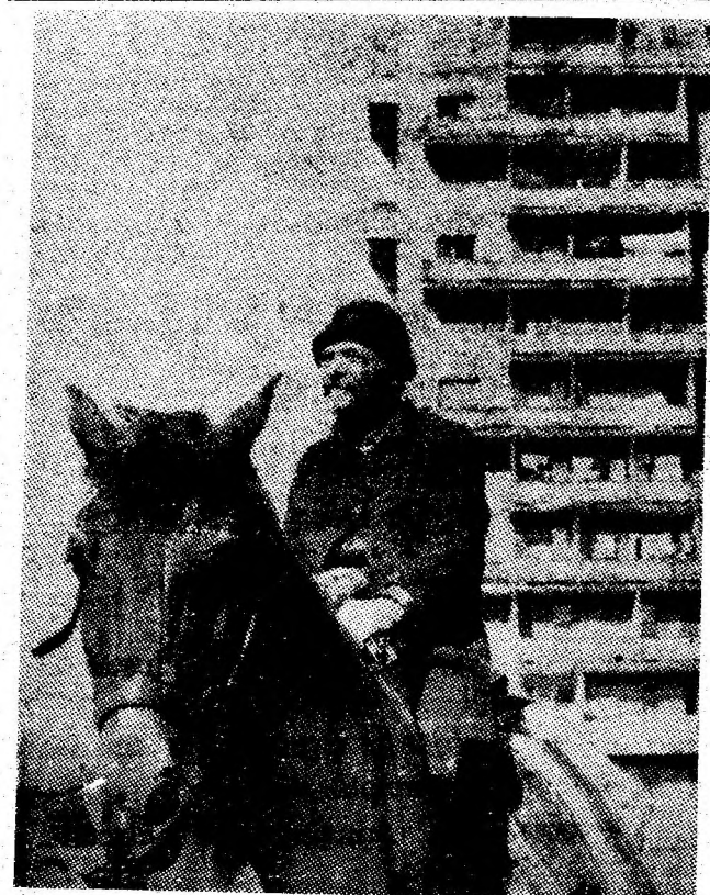
„Tună” badea de la munte.