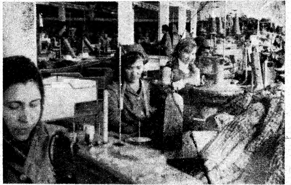
Instantaneu din secția confecției a fabricii de tricotaje din Petroșani, unde modelele prind conturul viitoarelor articole de îmbrăcăminte.

La ora 9,00, aeronava prezidențială a decolat, îndreptîndu-se spre Cipru.