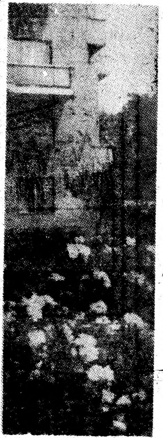
Petroșani. Armonie citadină.

La spectacol, realizat de Aurel Hlușcu și Gigi Croitoru, au participat tinerii din întreprinderile și școlile orașului Petrila, care s-au evidențiat în acțiunile de muncă patriotică. Este un început care anunță o permanență. (M.B.)