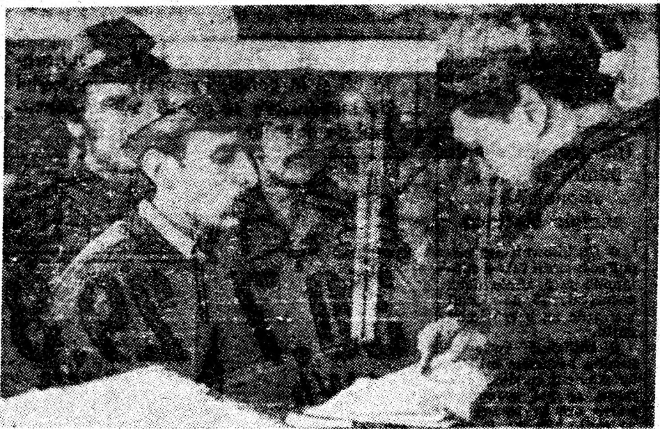
Sala de apel a minei Dilja. Instantaneu din timpul pontajului.

anumite ore, a reviziei curente a întregului flux de transport, fără a stînjini producția, se obțin importante economii de energie, care se regăsesc și în reducerea costurilor de producție în me-