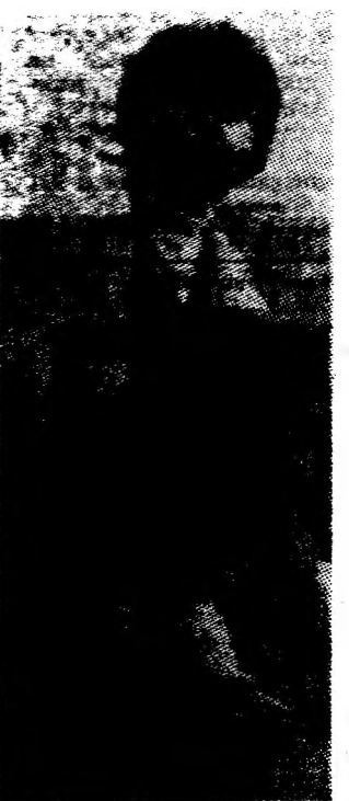
Urmas... cu tăticu