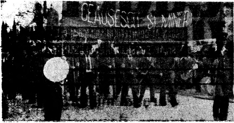
In gind și inimă — dragoste fierbinte pentru conducătorul iubit și stimat, secretarul general al partidului, tovarășul Nicolae Ceaușescu.