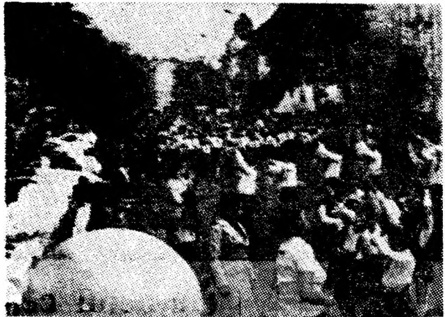
Pionierii ovaționează îndelung pentru partid și conducătorul său.