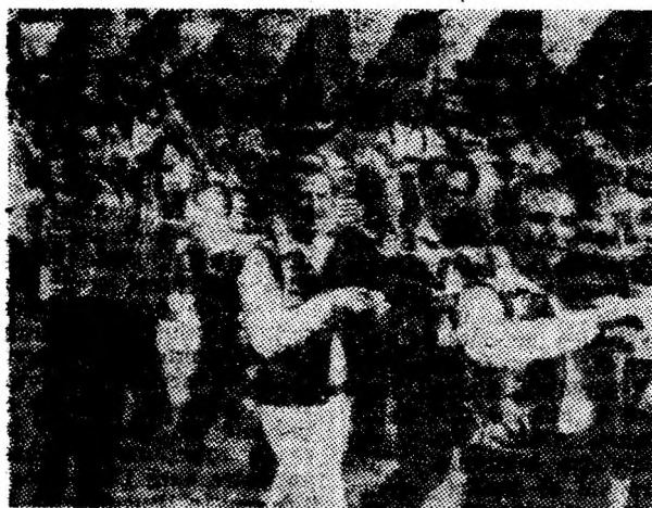
Trec artiștii amatori.

La marea sărbătoare a patriei, 23 August, pre- zența artiștilor amatori în coloana demonstrațiilor a simbolizat însuși conținut- ul nou al culturii din pa- tria noastră, diversitatea posibilităților de împlini- re a personalității minerilor, a oamenilor muncii din Valea Jiului, stimu- lați de marea manifesta- re a creației și hărniciei, Festivalul național „Cînta- rea României”.