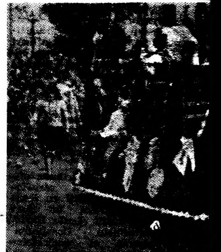
Primul car alegoric