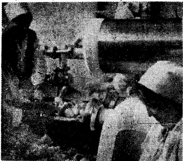
Instantaneu din secția înghețată a fabricii de produse lactate Livezeni.