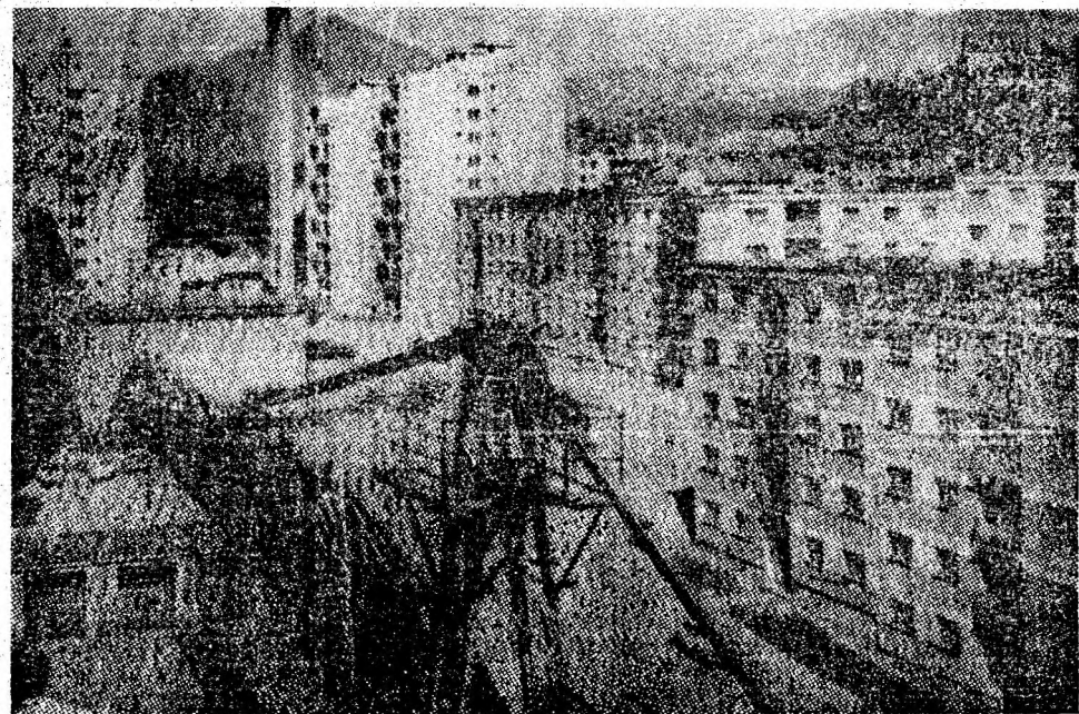
A „răsărit” un nou cartier în viitorul centru civic al Petroșaniului.

În pragul iernii, directorul E. T. P. afirmă: