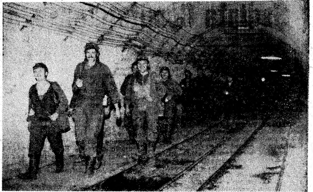
Minerii Paroșeniului pășesc pe magistralele subterane spre fronturile de lucru.

niții aveau suficiente pentru a face față cîteva ore. În spatele vitezei grupe, înaintarea dușmanului se împotmolise în porumbișul neculm. Cu nici un chip nu mai putea înainta. Întărită de eșecul suferit, marea unitate a cîmpitorilor hotărî să lichideze cuibul românesc de rezistență. Intenția lor era mărturisită de focurile concentrice, tot mai apropiate de cantonul 3. Puștile mitraliere de sub comanda sergentului Alexandru Prunea funcționau fără greș. Totuși spațiul dintre ei și fasciști se micșora cu repeziciune. Cîțiva mitralieri au fost răniți mortal. Cînd au început exploziile grenadelor, grupa lui Prunea s-a