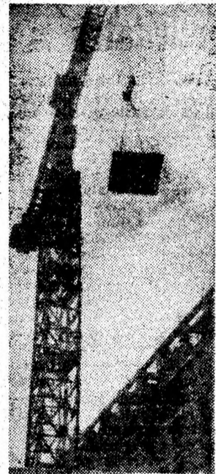
Cresc mereu etajele de la viitoarele blocuri din noul centru civic al Petrosaniului.