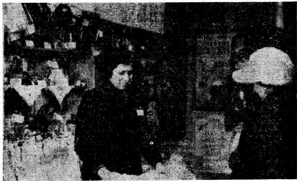
La magazinul „Bijuteria“ din Lupeni există un raion cu articole de artizanat, care pune la dispoziția populației un bogat sortiment de produse de bun gust, executate cu migală de meșteri populari.