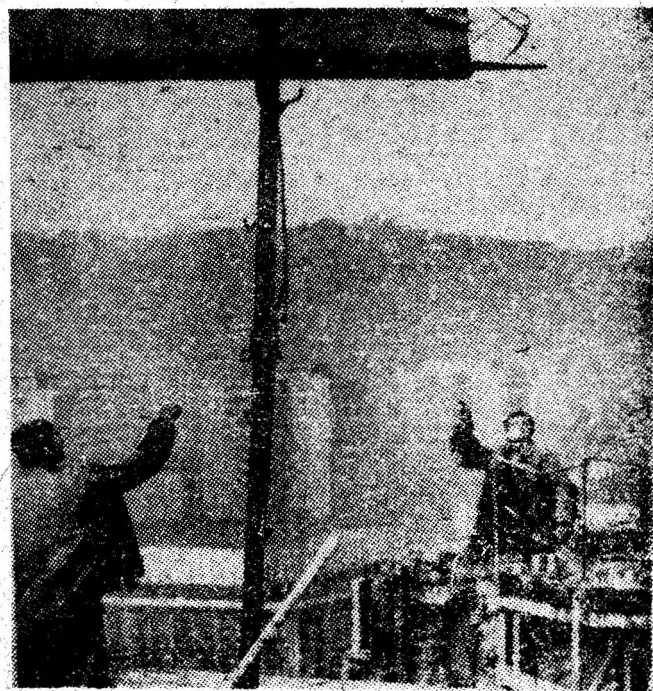
Echipa condusă de Gogu Neagoe montează planșeele de la cota finală a ultimului tronson EF de la Blocul 64 din viitorul centru civic al Petrosaniului.