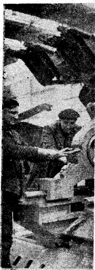
În secția de montaj a I.U.M. Petrosani se verifică suportul unei noi combine CA-2.