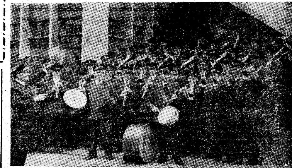
Fanfara minerilor Văii Jiului laureată în ediția a II-a a Festivalului Național „Cîntarea României”.

Dar paleta manifestărilor educative poate fi și mai bogată, gîndirea și inițiativa activiștilor culturali din Petroșani trebuie să fie irigată de cunoașterea faptelor de muncă și viață ale oamenilor muncii. Casa de cultură, deși dispune de o bază materială foarte bună și de posibilități organizatorice mult mai mari, susține sporadice manifestări pentru care publicul nu manifestă interes, sala de spectacole este de multe ori goală. De ce? Pentru că formațiile artis-