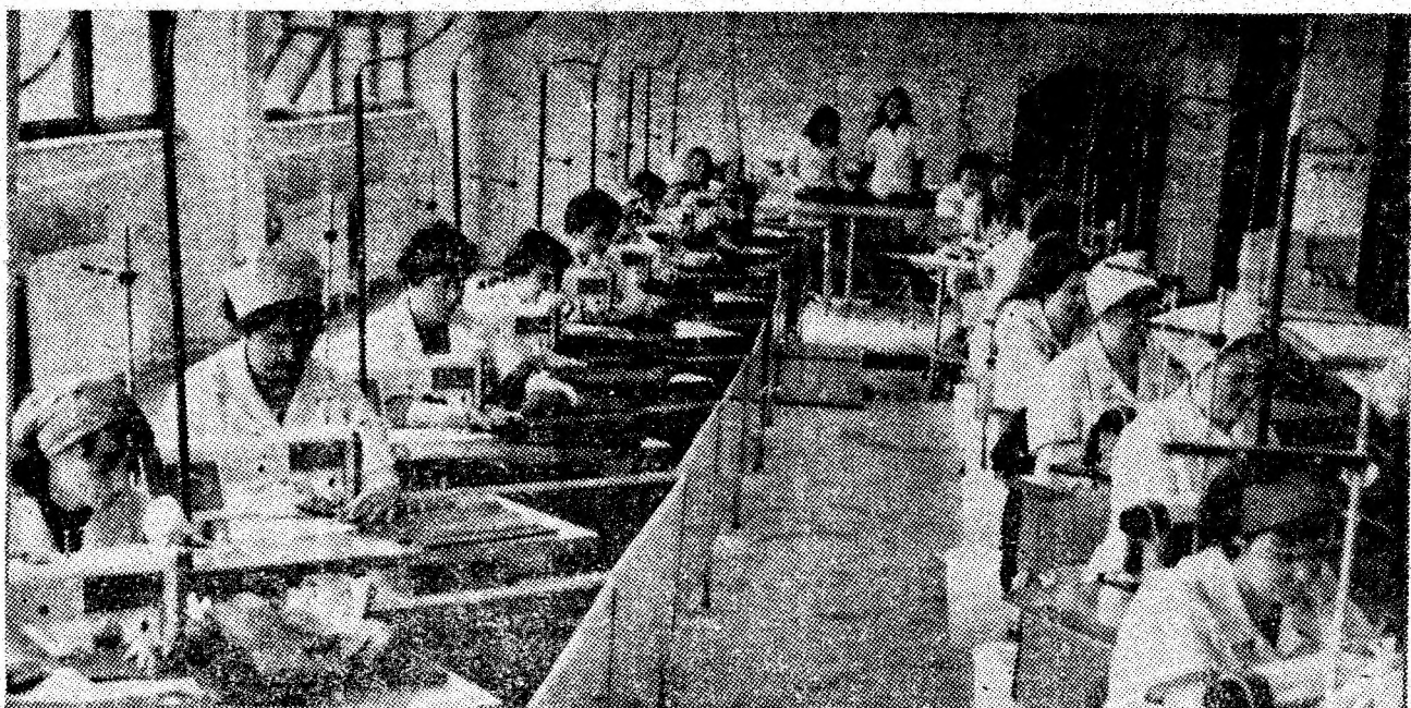
Prin grija partidului, ca o materializare a indicațiilor date de tovarășul Nicolae Ceaușescu, soțiilor și fiicelor minerilor li se asigură loc de muncă la Fabrica de confecții din Vulcan.