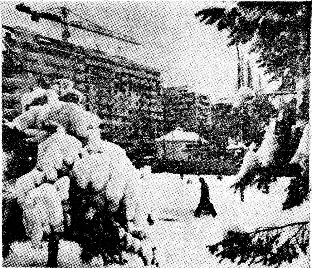
Semne bune anul are...