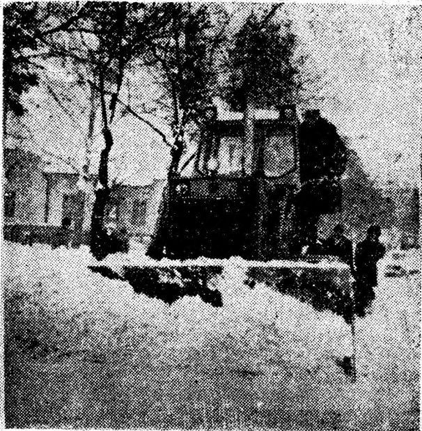
Buldozerele sînt la datorie...