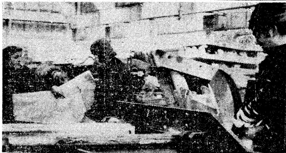
Instantaneu din secția de montaj a I.U.M. Petrosani, unde se asamblează combinatele pentru abatajele din subteran.