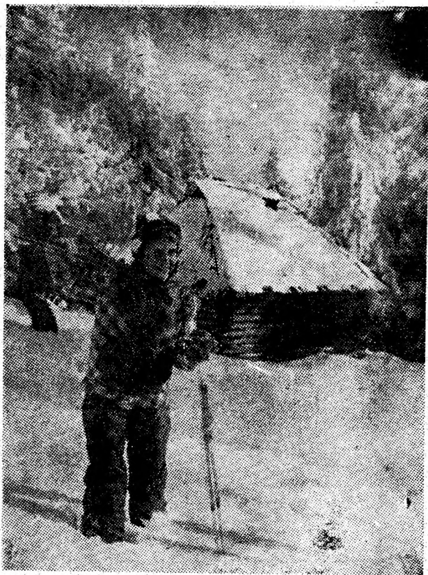
În drum spre crestele înzăpezite...

Un grup de scafandri și ingineri englezi intenționează să încerce, în vara acestui an, recuperarea epavei celebrului transatlantic „TITANIC”, scufundat, după cum se știe, în anul 1912, în urma ciocnirii cu un aisberg, la 600 km de insula Newfoundland? După părerea specialiștilor, „revela” principală a acestei temerare operațiuni constă în a descoperi corpul navei, aflat la o adîncime de aproximativ 3640 m. În acest scop a fost realizat un submersi-