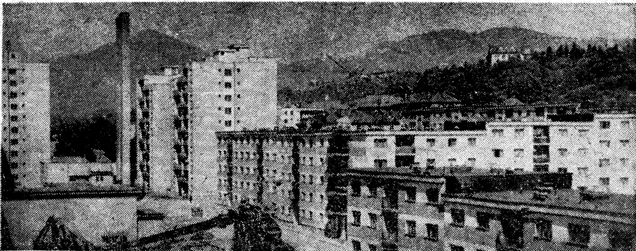
A „răsărit” un nou cartier în viitorul centru civic al Petrosaniului.